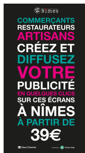
Illustration de la nouvelle plateforme mapubdigitale.fr à Nîmes

« Notre média a un rôle essentiel à jouer dans un contexte difficile pour notre économie et particulièrement pour le commerce local, durablement affecté par la crise sanitaire. Clear Channel met ainsi la puissance de son média au service du tissu économique local et de l'utilité collective pour une relance économique et solidaire durable. Ces plateformes digitales permettent des décrochages locaux accessibles et simples d'utilisation par les commerçants locaux pour que notre média digital joue pleinement son rôle d'acteur responsable solidaire et durable des centres-villes. Cela s'inscrit dans la continuité de notre partenariat historique avec l'association Centre-Ville en Mouvement et donne des réponses concrètes au 5 ème Baromètre des Centres-villes réalisé en partenariat avec l'association Centre-Ville en Mouvement et le