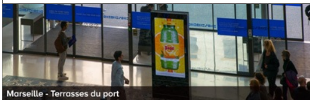
Marseille - Terrasses du port