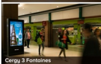
Cergy 3 Fontaines