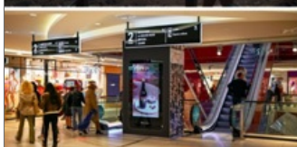
Paris - Italie 2