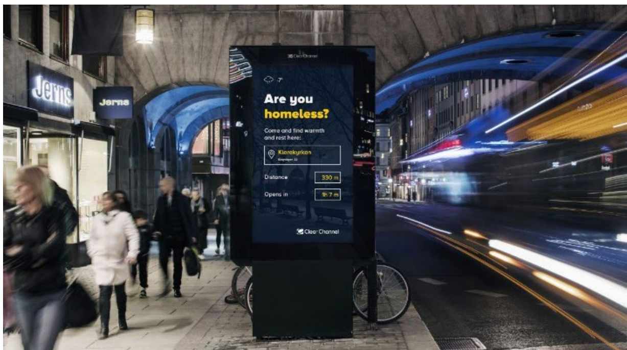
Campagne DOOH indiquant le centre d'hébergement le plus proche. Stockholm, Suède