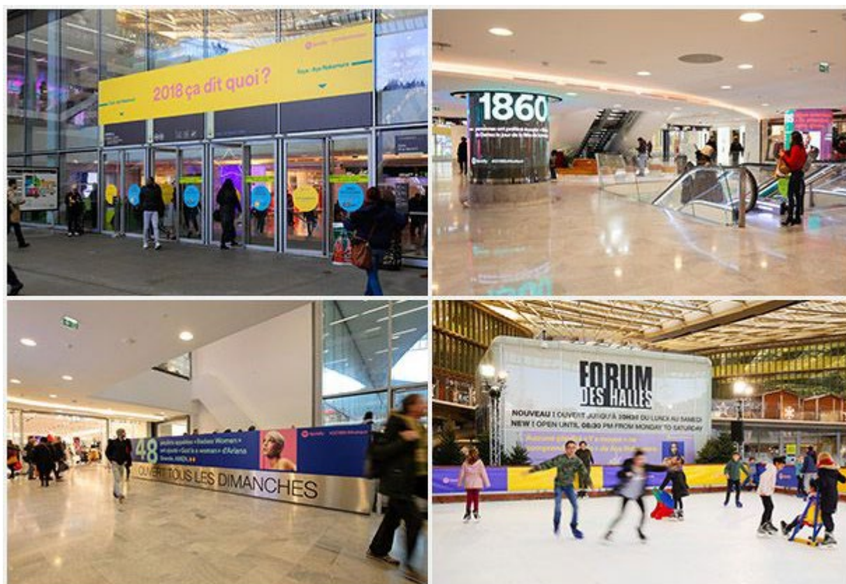
Spotify au Forum des Halles